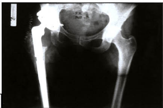
Fig. 1c. Caso 1: controllo a distanza (A-P) con paziente deambulante ed asintomatica.