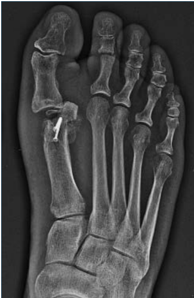
Figura 12. Esiti necrosi massiva della testa di M1 a seguito di osteotomia distale M1 tipo Austin; radiografia a 18 mesi dall'intervento.

Le alterazioni anatomopatologiche precedentemente esaminate possono condizionare differenti quadri clinici; i principali sono i seguenti.