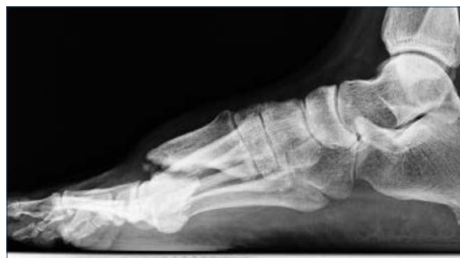
Figura 8. Malconsolidazione in plantarflessione della testa di M1 a seguito di osteotomia percutanea distale

direzione opposta a quella desiderata (Fig. 10); si osserva quasi esclusivamente come complicanza delle osteotomie percutanee di I^a generazione non stabilizzate.