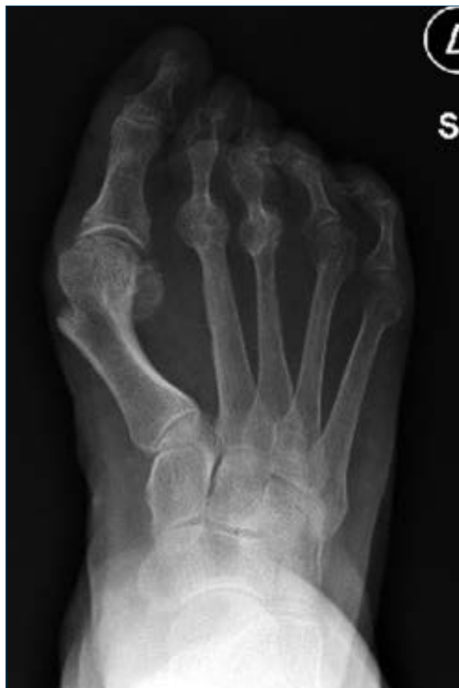
Figura 3. Esempio di errata indicazione: alluce valgo con importante varismo di M1 ed angolo intermetatarsale M1-M2 di oltre 20°; in queste situazioni una osteotomia distale non è in grado di correggere efficacemente la deformità.

La situazione più frequente è rappresentata dall'impiego di osteotomie distali di M1 in caso di angolo intermetatarsale M1-M2 molto accentuato (Fig. 3). Si stima che nelle osteotomie distali di M1 la dislocazione laterale della testa metatarsale corregga di un grado l'angolo intermetatarsale per ogni millimetro di spostamento 34,35 ; pertanto, considerato che mediamente la larghezza della testa di M1 non supera