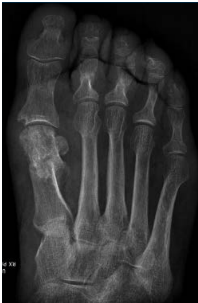
Figura 9. Malconsolidazione con importante ipometria a seguito di osteotomia percutanea distale di M1 sec Reverdin-Isham; la Paziente è sintomatica per importante metatarsalgia centrale

Le cause della pseudoartrosi possono essere ricercate in molti casi in una insufficiente stabilizzazione dell'osteotomia; questo problema può essere più evidente per le osteotomie prossimali, che hanno un lungo braccio di leva, o per osteotomie distali specie per quelle lineari che sono intrinsecamente instabili.