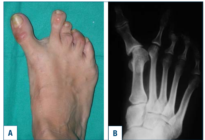
Figura 13. Alluce varo secondario ad osteotomia prossimale con angolo intermetatarsale M1-M2 negativo.

Sono espressione di una sofferenza articolare causata da