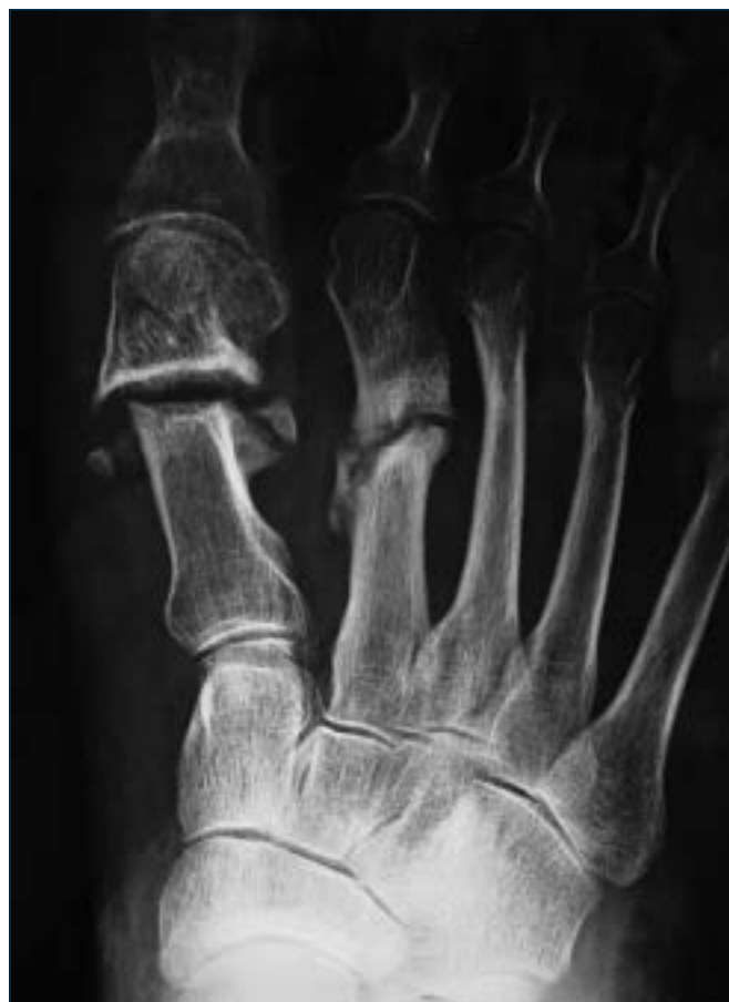
Figura 11. Pseudoartrosi in esiti osteotomia percutanea distale; concomita pseudoartrosi diafisaria di M2; sintomatica per metatarsalgia III IV ed insufficienza dell'alluce in fase propulsiva