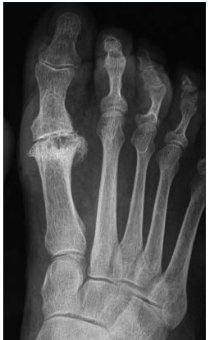
Figura 1. Esiti intervento di Hueter-Mayo con resezione della testa del 1° metatarsale; la condizione determina una importante insufficienza del 1° raggio con sovraccarico dei raggi centrali; è evidente nella radiografia l'instabilità della MF2 ed MF3.

La tecnica di Hueter-Mayo 32 consiste nella resezione più o meno allargata dell'estremo distale del 1° metatarsale (Fig. 1) che comporta nella maggior parte dei casi un im-