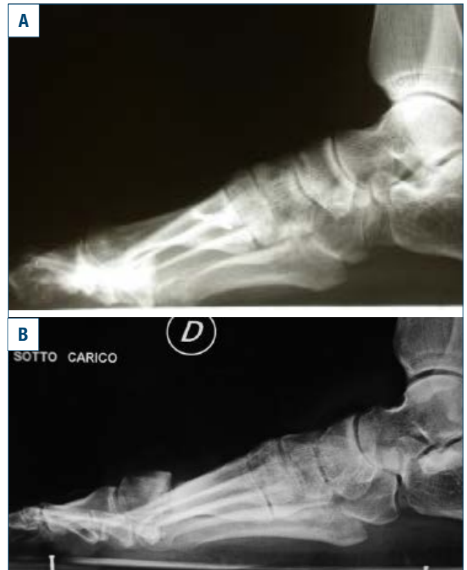
Figura 6. Malconsolidazione in dorsalizzazione a seguito di osteotomia prossimale di M1 (a) ed a seguito di osteotomia distale (b).

situazione che può essere osservata in tutte le osteotomie di M1 ma che è tipica delle osteotomie prossimali (Fig. 6). Le osteotomie prossimali per mantenere invariata la posizione della testa metatarsale devono essere eseguite con una cerniera ortogonale al piano di appoggio; se la direzione di questa cerniera è ortogonale all'asse maggiore del metatarsale, cioè in senso anteroposteriore e dorsoplantare, lo spostamento determinerà inevitabilmente un sollevamento della testa. Inoltre le osteotomie prossimali, a causa del lungo braccio di leva, sono intrinsecamente più instabili specie se il carico è troppo precoce o la stabilizzazione precaria. Una situazione particolare di sollevamento della testa metatarsale si osserva nelle osteotomie diafisarie tipo Scarf in cui si verifica un infossamento del moncone dorsale in quello plantare ("troughing") per insufficienza di contatto corticale e dell'appoggio metafisario in soggetti osteoporotici; tale complicanza incide fino al 35% dei casi di osteotomia tipo Scarf 38 .