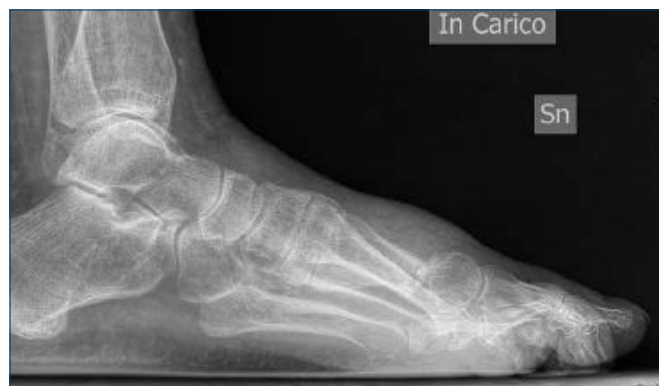
Figura 7. Malconsolidazione in rotazione dorsale della testa di M1 a seguito di osteotomia percutanea distale tipo Reverdin-Isham

È una eventualità rara in quanto il moncone distale del metatarsale osteotomizzato si disloca medialmente, nella