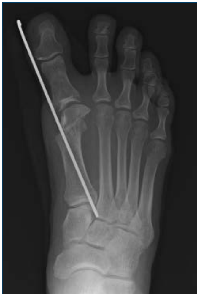
Figura 4. Osteotomia distale tipo PDO eseguita troppo distalmente; in questo caso è possibile si determini una incongruenza con l'apparato sesamoideo e conseguente rigidità articolare; inoltre aumentano i rischi di necrosi cefalica.