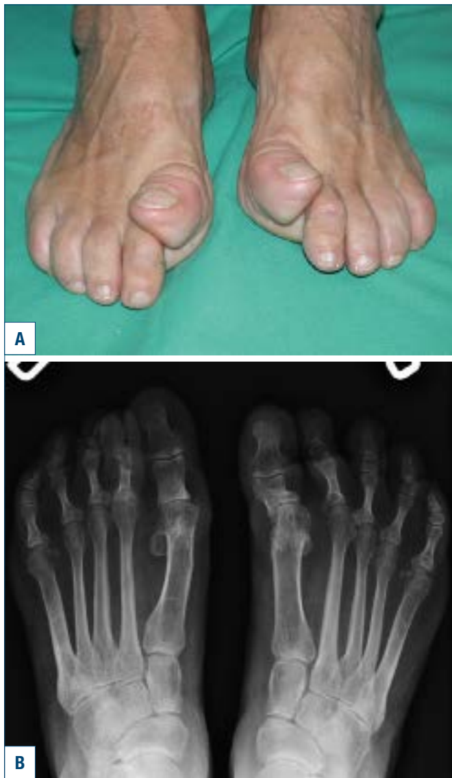
Figura 2. Esiti di intervento bilaterale di artroplastica MF1 sec. Keller-Brandes: la resezione della base della F1 determina la perdita delle inserzioni dei muscoli brevi dell'alluce con instabilità in dorsalizzazione della F1 ed insufficienza funzionale in fase propulsiva.

Anche l'artroplastica di Keller-Brandes successivamente modificata da Viladot 33 comporta limiti biomeccanici ben noti che dovrebbero farne limitare l'uso a soggetti anziani e poco attivi. Il problema principale è rappresentato dal fatto che la resezione della base della prima falange (F1) implica la perdita delle inserzioni dei muscoli brevi del 1° raggio con più o meno accentuata instabilità dell'alluce (Fig. 2); si riduce di conseguenza la forza di spinta dell'al-